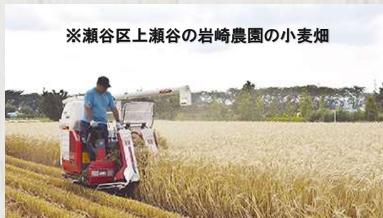
※瀬谷区上瀬谷の岩崎農園の小麦畑